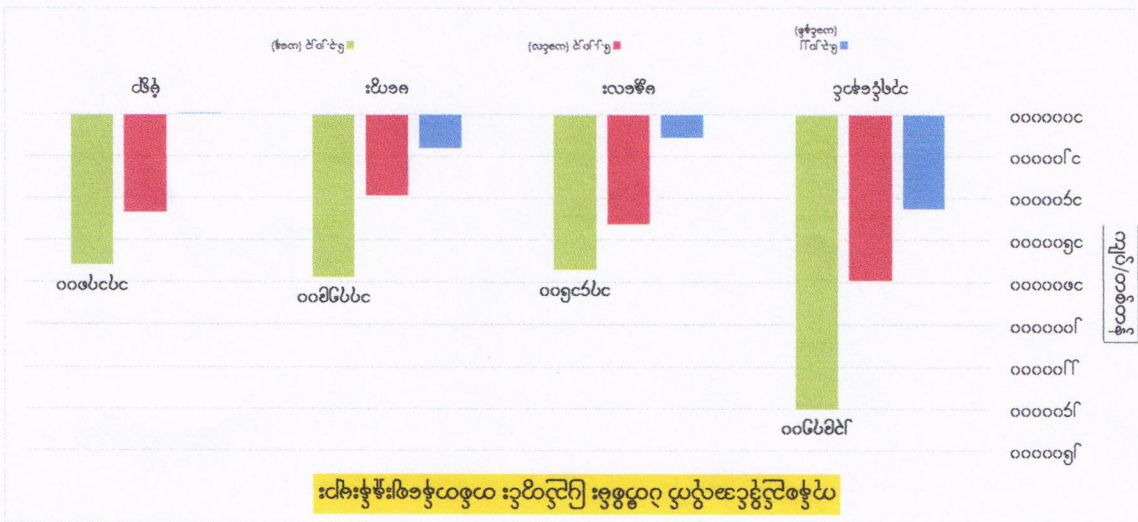
၀ဏ္ဏဝါ မသိသည့် လူဦးရေ